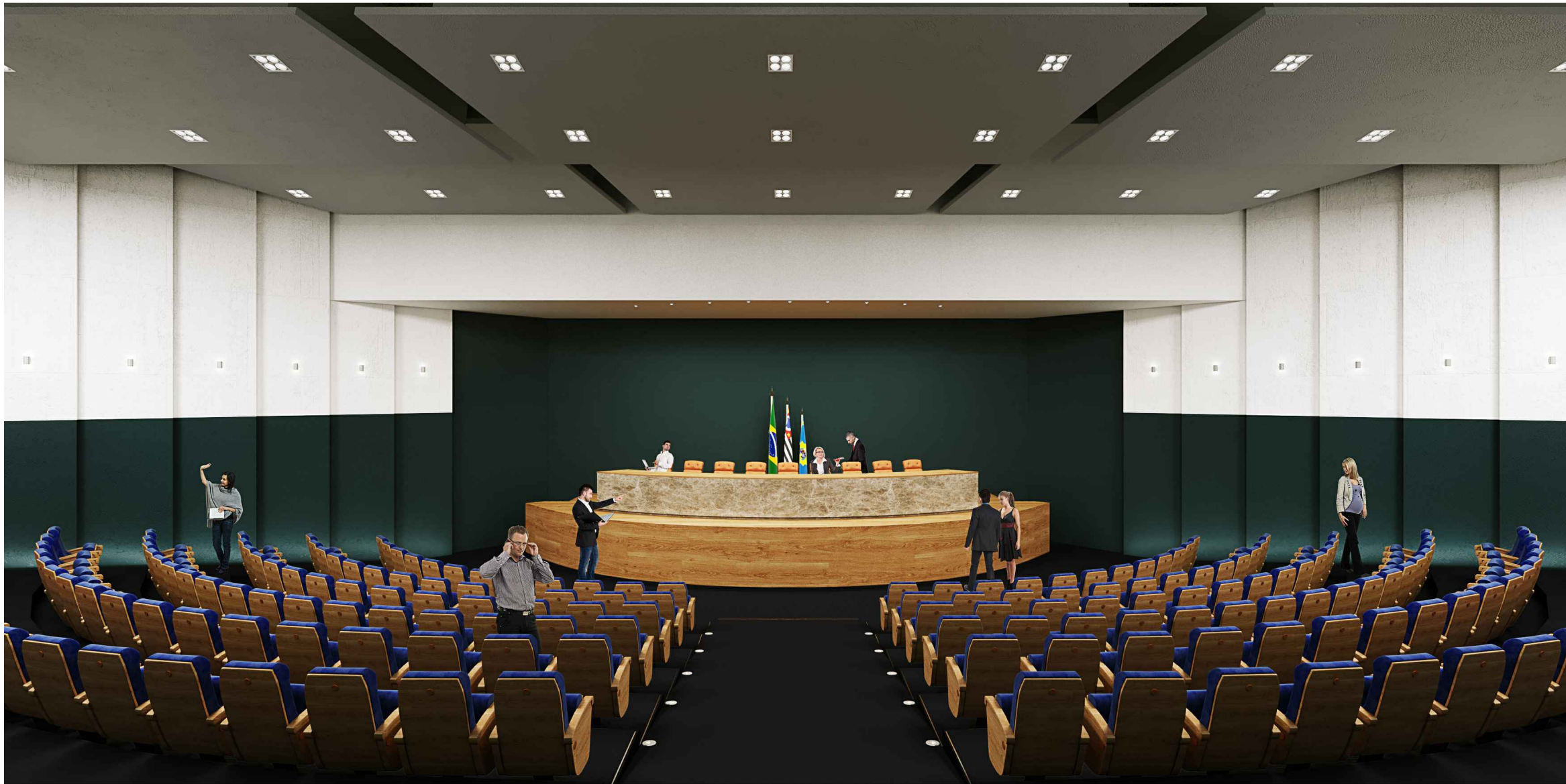
2 MAQUETE ELETRÔNICA - VISTA INTERNA (PLENÁRIO) Sem Escala

Nota: ESTE PROJETO ESTÁ DE ACORDO COM AS NORMAS E LEGISLAÇÃO RELATIVOS À NBR 9050 DE ACESSIBILIDADE E A NBR 6492 DE REPRESENTAÇÃO DE PROJETO DE ARQUITETURA.