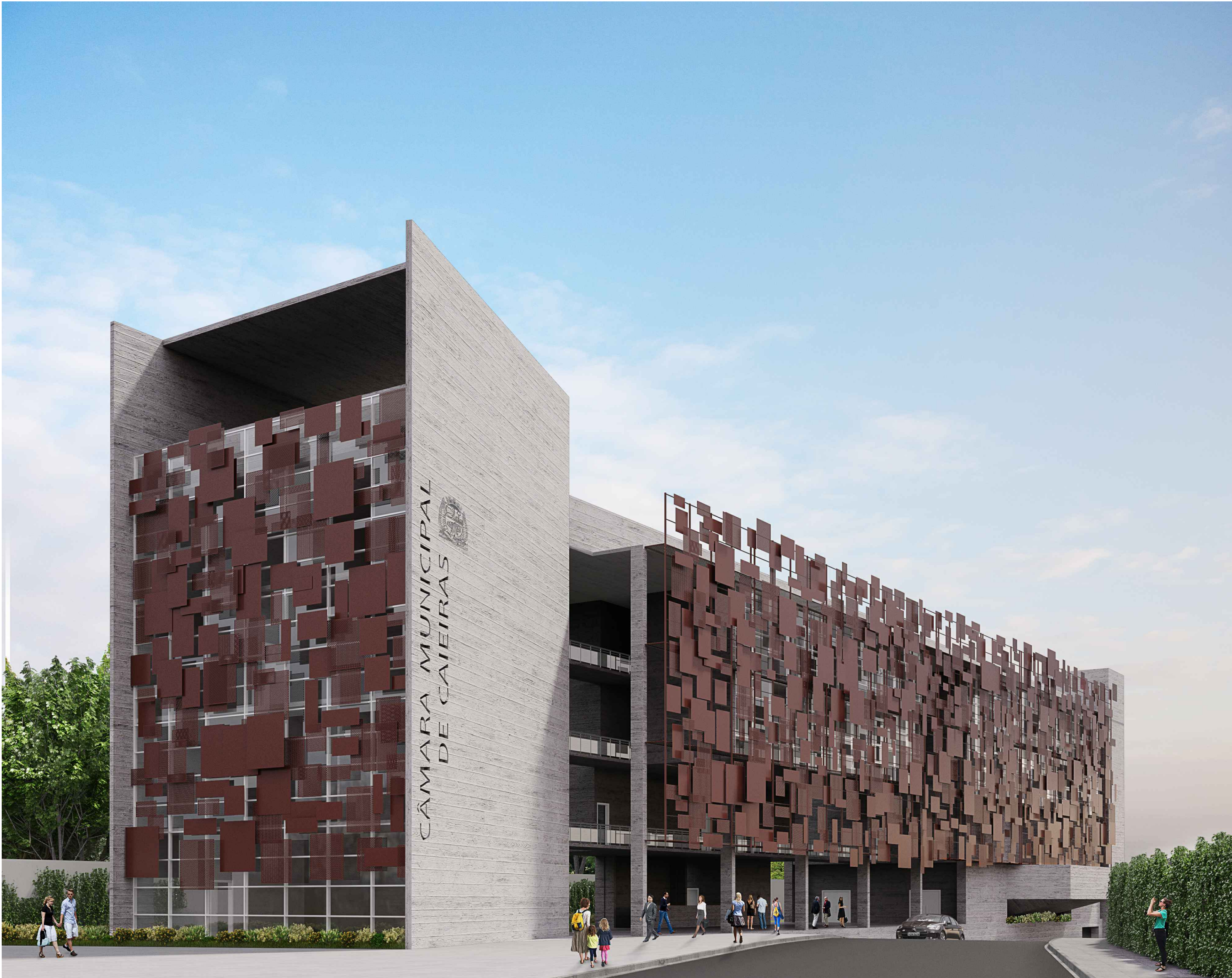
1 MAQUETE ELETRÔNICA - VISTA EXTERNA Sem Escala